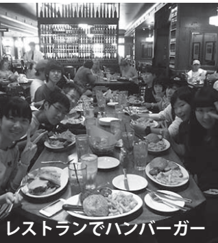
レストランでハンバーガー