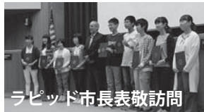
ラピッド市長表敬訪問