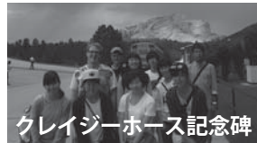
クレイジーホース記念碑