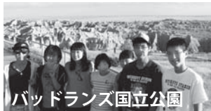
バッドランズ国立公園