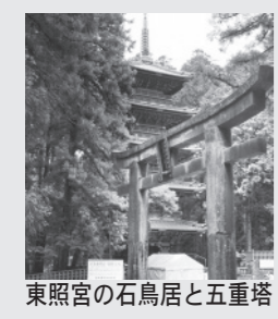
東照宮の石鳥居と五重塔

写真は、山内の東照宮表参道の石鳥居と五重塔です。実は、この風景の中にその鍵が隠されています。その謎解きについては、次回紹介します。