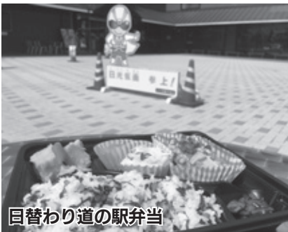
日替わり道の駅弁当