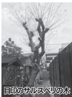
目印のサルスベリ たまごこじ の木

小路は、報徳二宮神社へと続く近道です。道の駅日光でサルスベリ たまごこじ の木を見つけたら、ちよっと寄り道していきませんか。