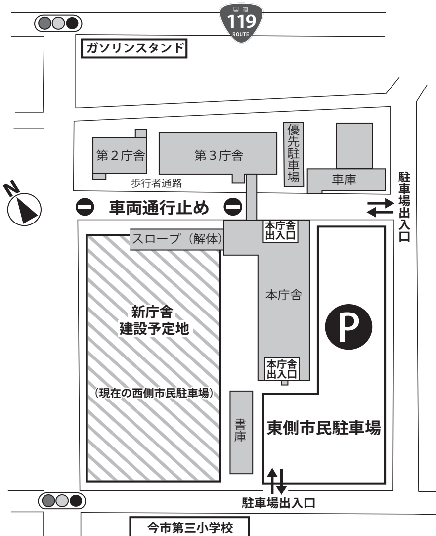
図：4月からの市民駐車場