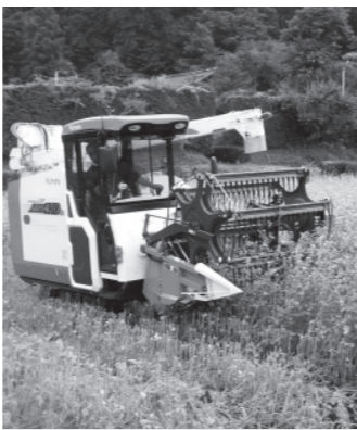
夏そばの刈り取りの様子

しかし、雑草の成長との戦いで、雑草に背丈を追い越されると収穫が困難になります。収穫時期の見極めが難しく、収穫量も「秋そば」に比べ少ないためコストがかかってしまうそうです。そのため地域の仲間と組合を作り、コンバインを2台購入して、共同で利用するなど、徹底的なコスト削減も行っています。 「日光に来れば、1年で2度新そばが食べられます。また、関東で一番早く新そばが食べられるため付加価値が上がります。手間暇