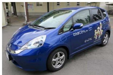
写真は市で導入した電気自動車です