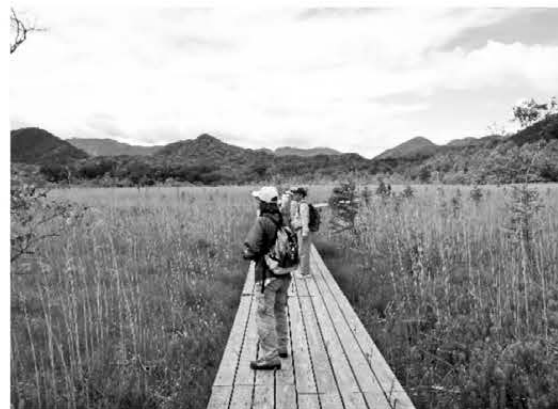
戦場ヶ原の木道を散策する参加者