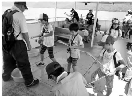
採水器を使って水質を調査する参加者