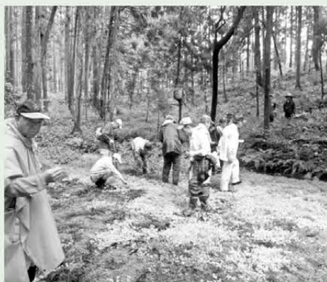
湧水地でのボランティア活動の様子