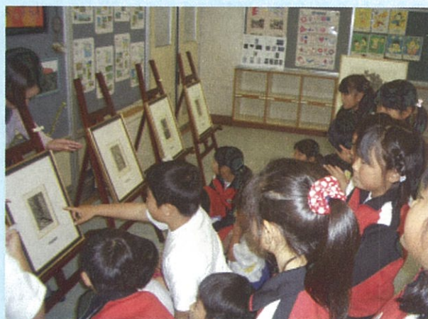
僕はこれ！（轟小学校）