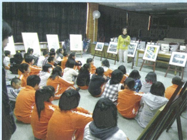
真剣なまなざし！（小林小学校）

“美術館に行かなくても本物の版画が間近で見られて、学芸員の解説付き！”「作品はどうやって鑑賞するの？」「絵をみてこんな感じがした…」こんな疑問に応える出前授業です。『移動版画展』は本年度も実施いたします。