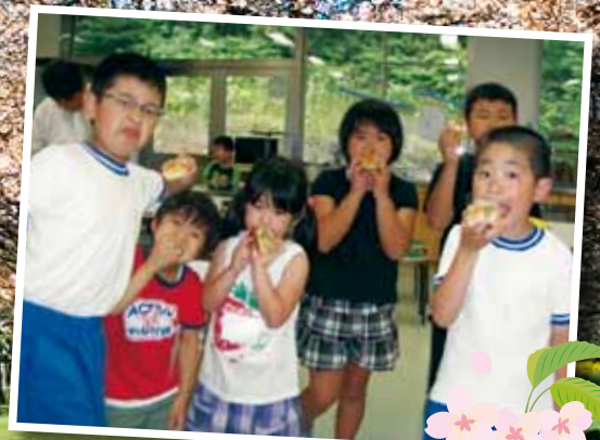
大沢地区放課後子ども教室