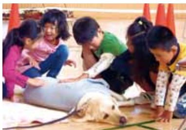
おとなしくて、かわいいね！

子ども達は盲導犬の生涯や、まちで盲導犬に会った時の注意点などについて学びました。