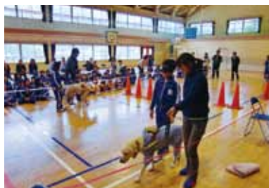
アイマスクをつけての盲導犬体験