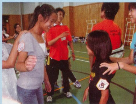
《小田原市のお友達とじゃんけんっぽん!》