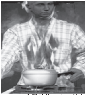
NITEの実験映像による着衣着火

市内では発生していませんが、全国的に「着衣着火」が原因の火災、死亡事故が多発しています。消防庁のデータによると、着衣着火による死者は過去5年間で492名となっており、毎年100名前後の方が亡くなっています。