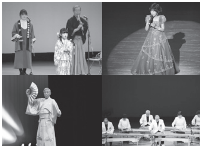
2023年新春芸能発表会の様子