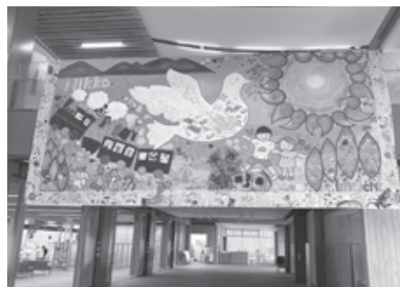
令和5年の市役所での展示