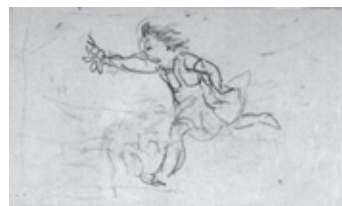
小杉放菴「人物(女の子)」制作年不詳 小杉放菴記念日光美術館蔵