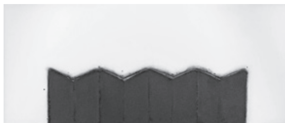
菊地武彦「線の形象2016-12」2016年 小杉放菴記念日光美術館蔵