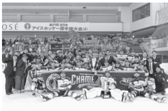
H.C. 栃木日光アイスバックスのメンバー

令和5年12月に神奈川県横浜市で開催された第91回全日本アイスホッケー選手権大会(A)で、H.C. 栃木日光アイスバックスが、4年ぶりに優勝しました。