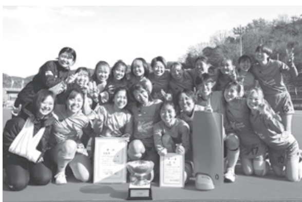
グラクソ・スミスラインのメンバー

令和5年12月に岡山県で開催された第84回全日本女子ホッケー選手権大会で、グラクソ・スミスライン Orange United が準優勝しました。