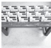
▲ラジオ付きライト