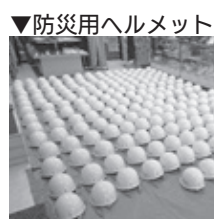
▼防災用ヘルメット