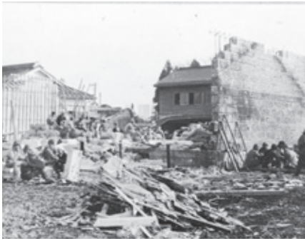
今市地震で被害を受けた家屋など

また、日光に甚大な被害をもたらした今市地震からは、74年たち、記憶が薄れつつあります。一方で、政府の地震調査委員会によると、今後30年に首都直下型の地震が発生する確率は70%とされています。