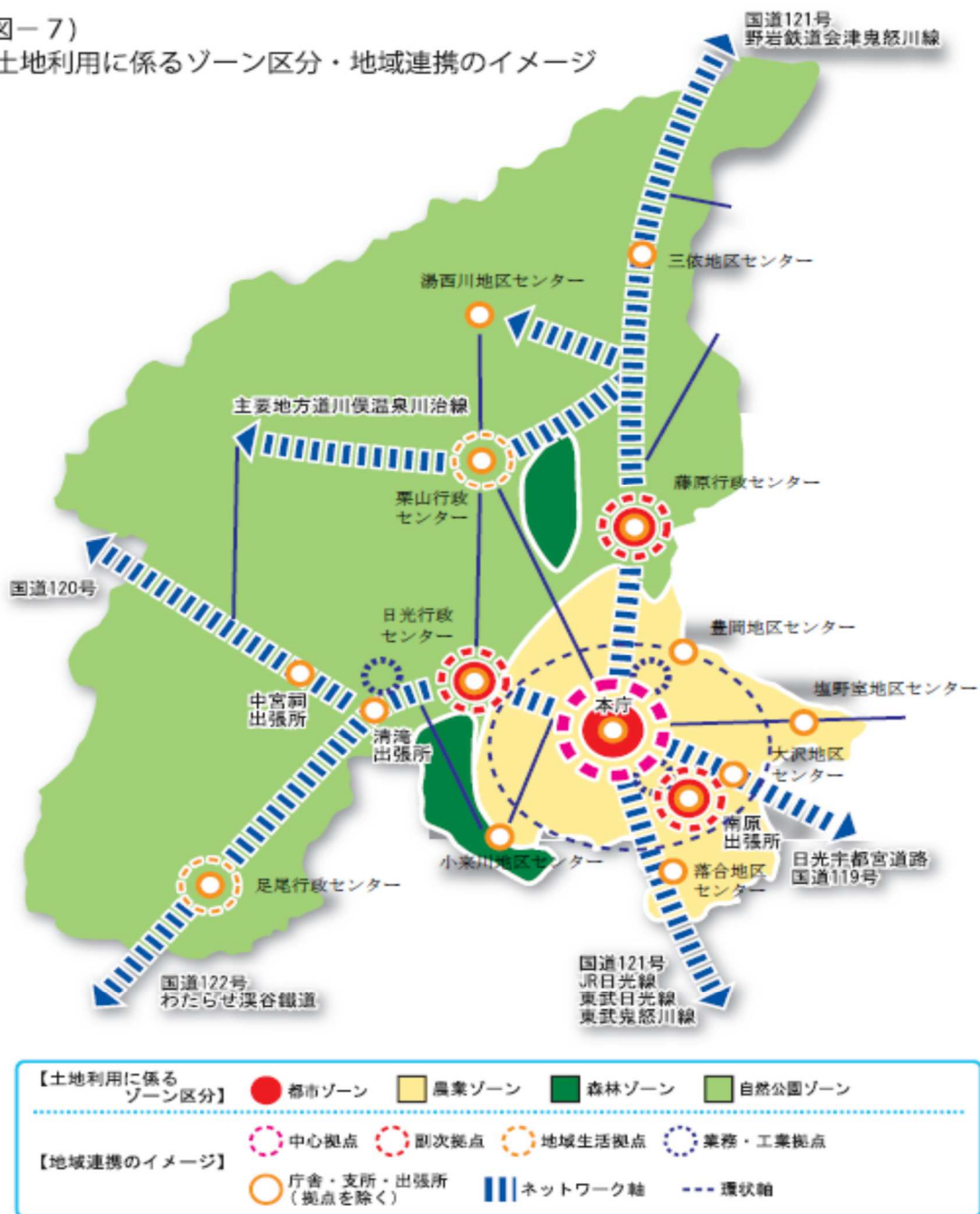
(図-7) 土地利用に係るゾーン区分・地域連携のイメージ

土地は、圏域での生活や生活などの諸活動に必要な共通な基盤であり、豊かな自然環境の保全を基本に、圏域を構成する諸地域の社会的、経済的、文化的な諸条件に配慮しながら、それらが有機的に結びつき、均衡ある発展につながる都市空間構造の形成を図り、誰もが暮らしやすいコンパクトなまちづくりを目指す。