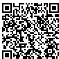
「とちぎ県民カレッジ」

「学習のあゆみ（手帳）」の申込みや講座情報など、とちぎ県民カレッジに関することは、「とちぎレインボーネット ( https://www.tochigi-edu.ed.jp/rainbow-net/ )」をご覧ください。下記までお問い合わせください。