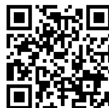
「とちぎかがやきネット」

また、「とちぎかがやきネット」( https://www.tochigi-edu.ed.jp/rainbow-net/kagayaki )ではボランティアに関する県内の情報を検索できます。