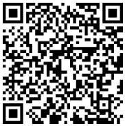
「日光市民活動支援センター」

※詳しくは、ホームページ https://www.city.nikko.lg.jp/soshiki/3/1009/5/6/index.html をご覧ください。