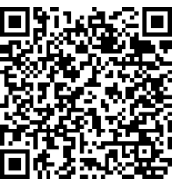
「日光市 市民ボランティア活動補償制度」

※補償対象活動、補償額など、詳しくは地域振興課までお問い合わせいただくか、市のホームページ https://www.city.nikko.lg.jp/soshiki/3/1009/5/378.html をご覧ください。