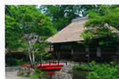
会場：平家の里 観覧時間 / 8:30~17:00