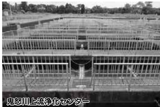
鬼怒川上流浄化センター

市税の減少や普通交付税の縮小など、一般会計の財源確保が困難な状況を踏まえ、財源補てん額の縮減を図る必要性が生じています。また、下水道事業は公営企業として独立採算による経営が原則であることから、収支計画により将来の見通しを立てたうえで使用料改定に取り組むこととしました。