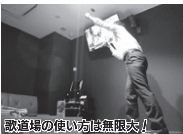
歌道場の使い方は無限大！

◆ ◆ 船村徹記念 館3階で、7 月7日(金)か ら「『ありが とう船村徹先 生』100 人が綴る作曲家船村徹先生への手紙 展」が開催されます。ぜひお越し ください。