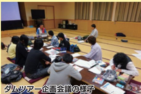
ダムツアー企画会議の様子

の魅力を 引き出 し、観光 資源とし て楽しん でもらう ためのさ まざまな 活動に取 り組んで います。