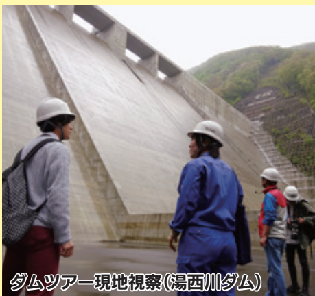
ダムツアー現地視察(湯西川ダム)