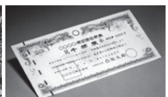
有価証券など 129億9,338万円