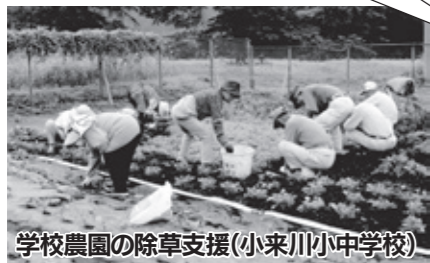
学校農園の除草支援(小来川小中学校)

地元の伝統行事「十三夜のお祭り」に使う「こんにゃく棒づくり体験」を行いました。保護者も参加し、こんにゃく棒のいわれや使い方も教わり、お祭りの様子を味わいました。