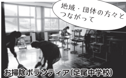
お掃除ボランティア(足尾中学校)