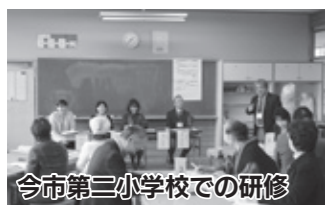
今市第三小学校での研修

さまざまな学校のボランティアと交流することは、その後の活動の参考になります。興味のある方は参加してみませんか? 広報紙で開催案内をしています。