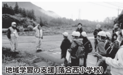
地域学習の支援(落合西小学校)

この事業は、「地域と学校が協力・連携して、日光に住む大人たちが、日光の子どもたちをみんなまで応援しよう」という事業です。 より多くの幅広い層の地域の皆さん・団体の皆さんが参加し、子どもたちの成長に関わってもらうことにより、子どもたちは、地域のすてきな人々を知り、ふるさと「日光」を愛する人になっていくことでしょう。 子どもたちの成長のために役立ちたいという思いを持っている皆さん、今まで培った「知識」「技能」「経験」など、持っている力を「学校支援ボランティア活動」で発揮してみませんか。 キラキラと輝く目をした子どもたちと過ごす時間は、きっと皆さんの宝物になります。