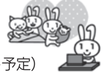
マイナンバー PR キャラクター マイナちゃん