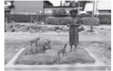
くまいじゅんいち 熊井淳一「ある日の牧場」2003年