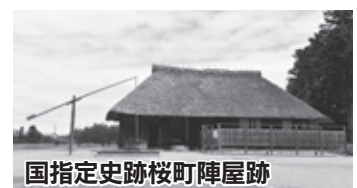
国指定史跡桜町陣屋跡