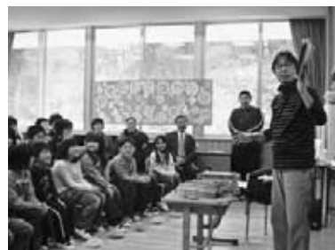
好評だったお話し会の様子。