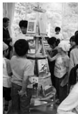
手作りの本棚は、「キキリン」と命名。

全校児童27名、完全複式の栗山小学校の読書活動は、地域の方々に支えられています。地域の読み聞かせボランティア「おはなしくらぶ・つくしんぼ」は、開校以来、年に一度「つくしんぼむら」というお話し会を開催してくれており、今年度は手作りの影絵も披露してくれました。また、児童の父親などで結成された「おやじの会」は、本棚や本立てを材料費のみ