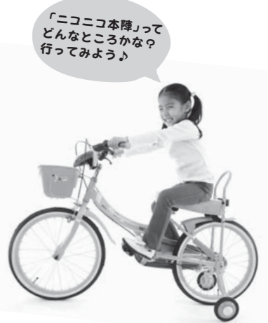
「ニコニコ本陣」ってどこかな? 行ってみよう!

日光のフレッシュな野菜・フルーツはもちろん、人気の日光グルメ・土産を一堂に集めた個性豊かな複合ショップです。