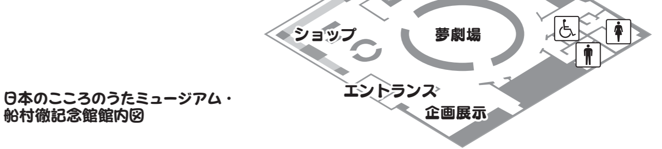
日本のこころのうたミュージアム・船村徹記念館館内図