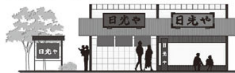
図：自家用広告物の表示例

自家用広告物も観光客などへのおもてなしの一部となります。また、同時に良好な景観づくりのための大きな要素になりますので、ご協力をお願いします。