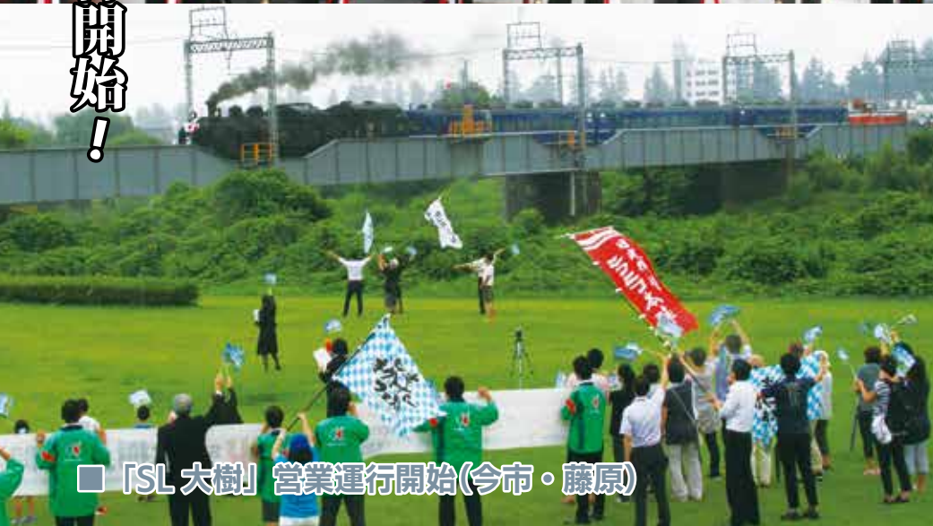
■ 「SL大樹」 営業運行開始(今市・藤原)