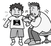
表：平成29年度インフルエンザ予防接種実施医療機関一覧