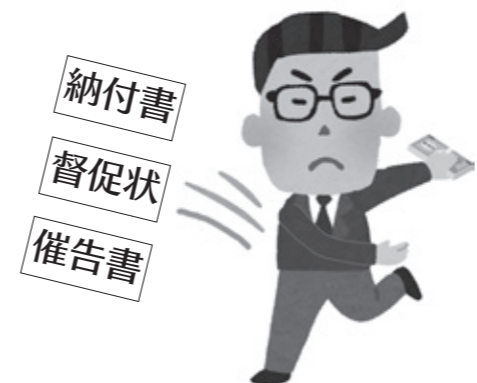
資力があるのに滞納すると… (次のページ)