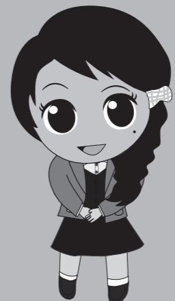
市役所税務課 徴税吏員 日光若葉