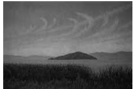
入江観 「湖上凱風」1992年 小杉放菴記念日光美術館蔵