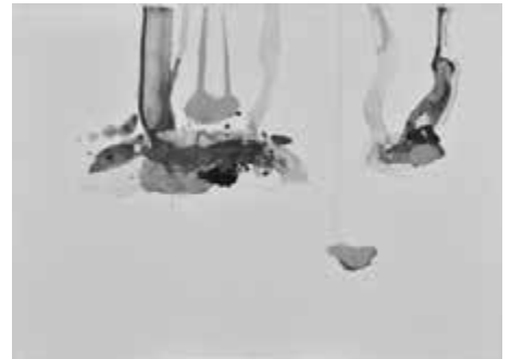
菊地武彦 「土の記憶2006-36」2006年 小杉放菴記念日光美術館蔵