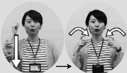
こぶしをつくり下ろす 人さし指を曲げる