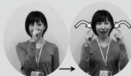
人さし指と中指を額に当てる 人さし指を曲げる