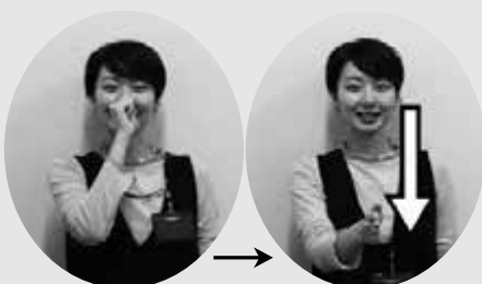
こぶしを鼻の前につくる 手を開いて下ろす 「よろしくお願いします」