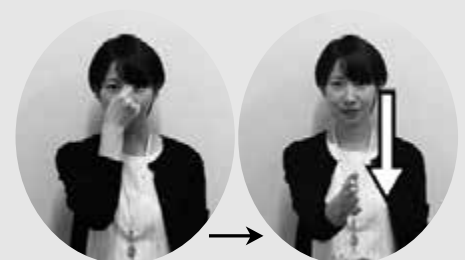
眉間をつまむようにする 手を開いて下ろす 「すみません」