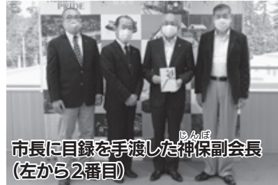
市長に目録を手渡した神保副会長(左から2番目)

公正で健全な税制の実現を目的とした活動を行う、公益社団法人鹿沼日光法人会から、市へ手指消毒用アルコール5リットル、10本が寄贈されました。