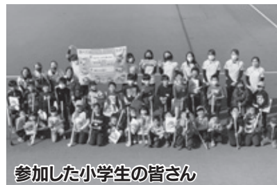
参加した小学生の皆さん

日光市の特色あるスポーツの一つであるホッケー競技の普及を目的とした「第16回ホッケーで遊ぼう! (初心者向け体験会)」を開催しました。