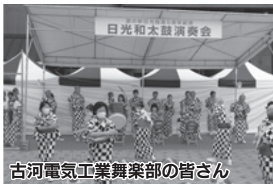
古河電気工業舞楽部の皆さん

4月に開業5周年を迎えた道の駅日光で、日光和太鼓演奏会が開催され、6団体が参加しました。新型コロナウイルス感染症拡大により、予定イベントが自粛となる中、5周年記念イベントとして今年度初めての開催となり、来場した皆さんの拍手とともに和太鼓の力強い音色が響き渡りました。