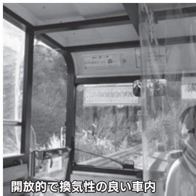
開放的で換気性の良い車内