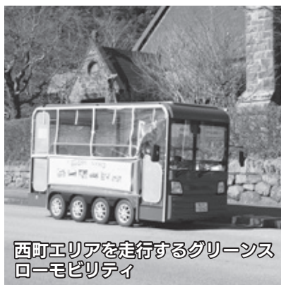
西町エリアを走行するグリーンスローモビリティ