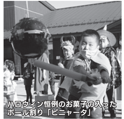
ハロウィン恒例のお菓子の入ったボール割り「ピニャータ」

10月31日(土)、ニコニコ本陣で市国際交流協会主催のハロウィン体験イベントが開催され、市内在住の親子30名が参加しました。参加者は、ゲストの市内在住の外国人たちと交流しながら、仮装コンテストやハロウィンにちなんだミニゲームを行い、楽しいひとときを過ごしました。