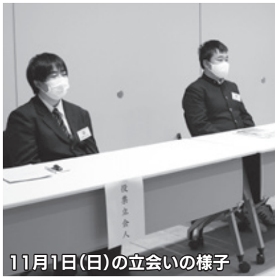
11月1日(日)の立会いの様子