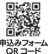
申込みフォーム QRコード