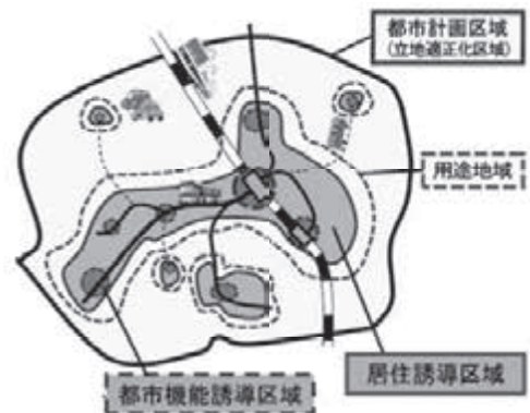
誘導区域のイメージ図

計画の期間は令和3年度～令和22年度(20年間)です。 ※パンフレットや届け出に関する内容は、問合先窓口または市ホームページでご確認ください