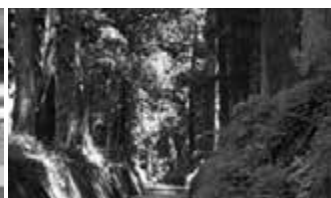
立木 日光街道杉並木に属する杉10本