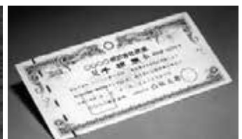
有価証券など 108億1,382万円