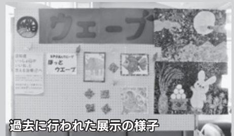
過去に行われた展示の様子

今回はコロナ禍のため、例年実施してきたステージ・体験教室・抽選会などは行わず、感染対策を徹底して「展示」のみ実施します。ご来場をお待ちしています。