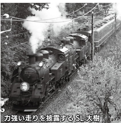
力強い走りを披露するSL大樹

10月1日(金)、SL復活運転後初めて、蒸気機関車2台をつなげて走る「SL大樹重連運転」が鬼怒川線で実施されました。当日は雨模様となりましたが、「C11形207号機」を先頭に「C11形325号機」を2両目に連結して走り、乗客と沿線に集まった多くの鉄道ファンを喜ばせました。