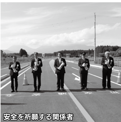
安全を祈願する関係者