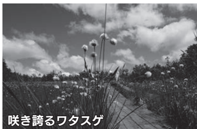
咲き誇るワタスゲ

急登を登りつめた先にある高層湿原「鬼怒沼」です。息を切らせ、たどり着いた先には、四季折々の高山植物が咲き誇る別世界の天空湿原が広がっています。