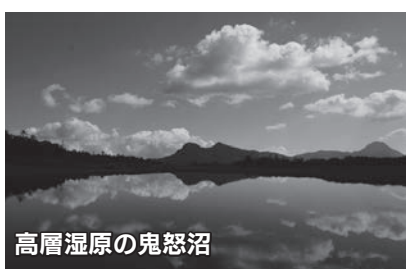
高層湿原の鬼怒沼

高層湿原「鬼怒沼」です。私が特に勧めるところは、奥鬼怒温泉郷からさらに2時間半程、