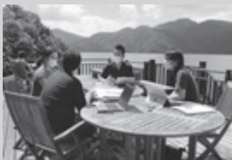
自然の中でワーケーション