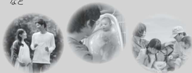
ワークライフバランスの推進