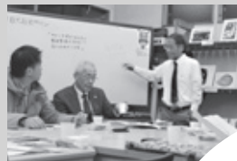
日光市起業・創業支援サロン