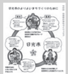
まちづくり基本条例の周知啓発