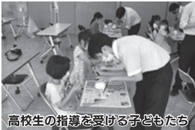
高校生の指導を受ける子どもたち