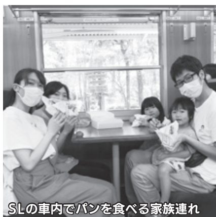
SLの車内でパンを食べる家族連れ