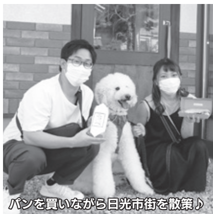
パンを買いながら日光市街を散策♪