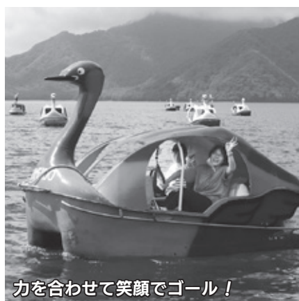
力を合わせて笑顔でゴール!

レースは、桟橋から約50メートル沖合にある目印までを往復するもので、スタートのサイレンが鳴ると、