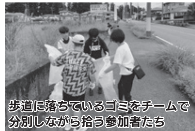
歩道に落ちているゴミをチームで分別しながら拾う参加者たち

スポGOMIとは、制限時間内に決められたエリアのゴミをチームで拾い、ゴミの量と質でポイントを競い合うスポーツのことで、日光青年会議所が大会を企画、運営しました。