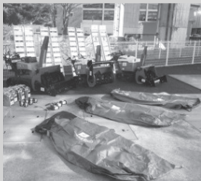
▲足尾地域自治会長会に整備された機材

足尾地域のコミュニティ活動の充実を図るため、この事業を活用し、足尾地域自治会長会に対し、除雪に使用する備品・機材類を整備しました。