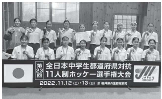
栃木県中学生女子代表チーム

令和4年11月に福井県で開催された、第23回全日本中学生都道府県対抗11人制ホッケー選手権大会女子の部で、日光市の中学生で構成される、栃木県代表チームが3位入賞しました。