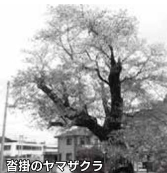
沓掛のヤマザクラ

伝説によると、今はまったく見えないが、昔この木の根元には、地蔵尊が置かれていて、木の成長によって幹の中に埋まってしまったそうじゃ。