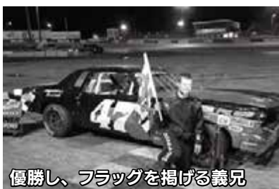
優勝し、フラッグを掲げる義兄

ちなみに、私の義理の兄は、地元のレーシング大会に参加し、優勝したことがあります！