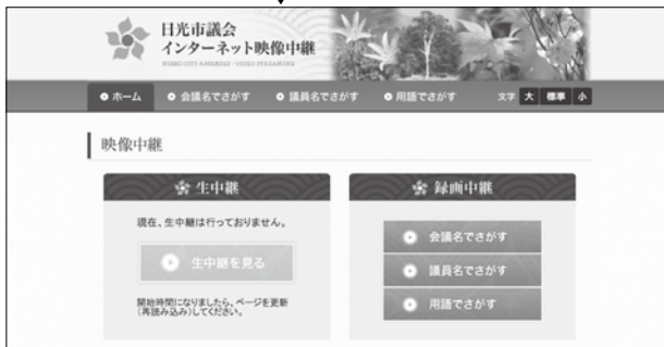
インターネット映像中継のページ