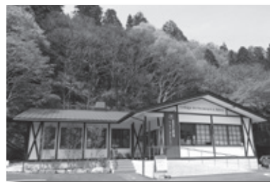
▲カテッジイン・レストラン▼

☎70-1171・FAX70-1172・✉konkatu@nikkocci.or.jp