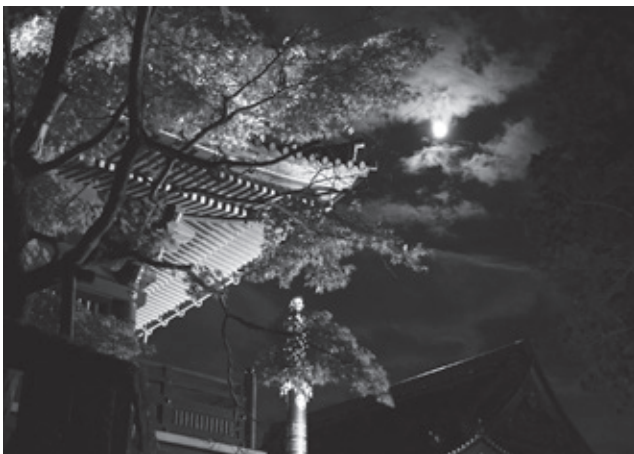
▲ライトアップされた社寺

問…ライトアップNIKKO実行委員会事務局(日光商工会議所日光事務所内) ☎50-1171