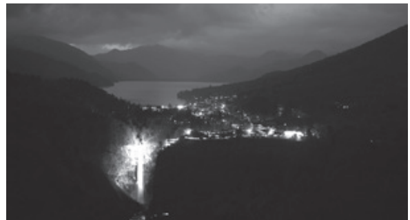
▲明智平から見る華厳の滝

問…奥日光観光事業振興会(一般社団法人日光市観光協会日光支部内) ☎22-1525