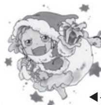
◀イラスト…やないふみえ