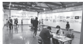
令和3年度展示風景▶