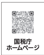
国税庁ホームページ