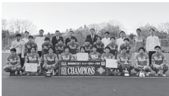
リベ 優勝杯を手にした LIEBE 栃木のメンバー

瑞宝双光章を受章。昭和34年に高等学校講師、昭和36年に教員となり、平成3年に川治中学校教頭、平成4年に三依小学校長を歴任。