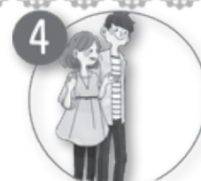
4 交際、そして結婚へ

相手が承諾すれば結婚相談員が日程調整や当日のサポートをします。オンラインでのお引き合わせも実施中!